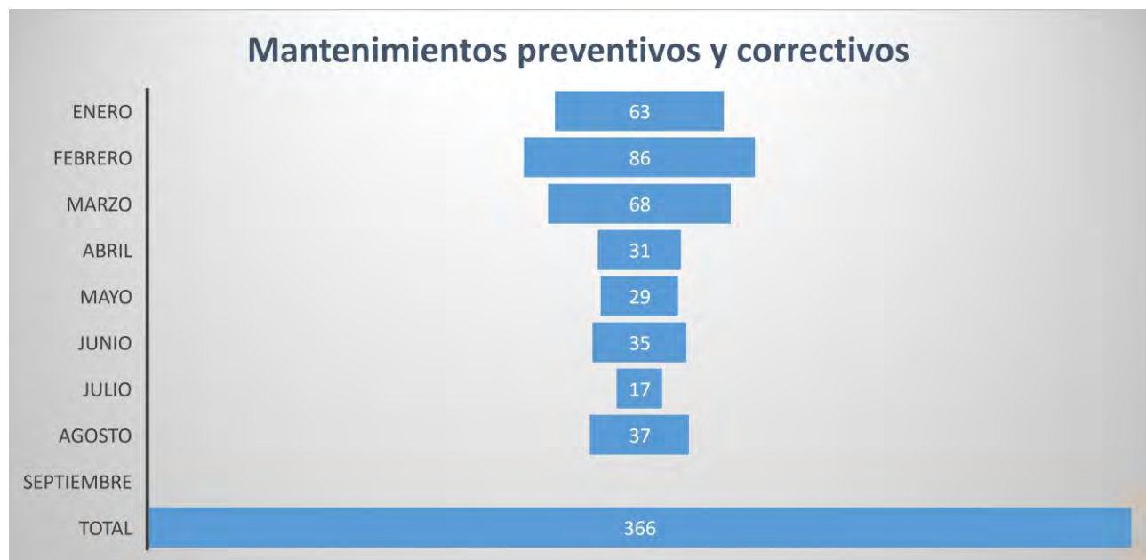
Tabla 1.- Mantenimientos por mes y sumatoria del total.

La información se encuentra dividida por cada mes detallando la persona que realizó el reporte, fecha de inicio, descripción del mantenimiento realizado, turno en el que se atendió, estado de la orden, fecha de termino y finalmente la persona encargada de registrar la orden de mantenimiento.